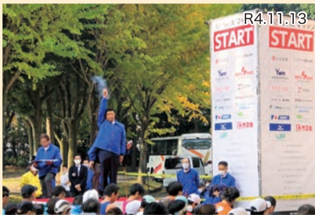
第42回つくばマラソン