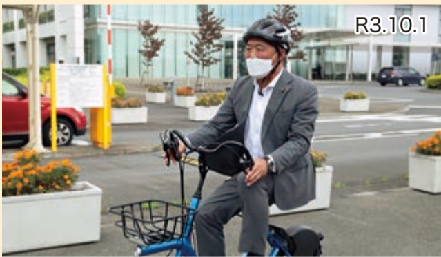
シェアサイクル「つくチャリ」出発式