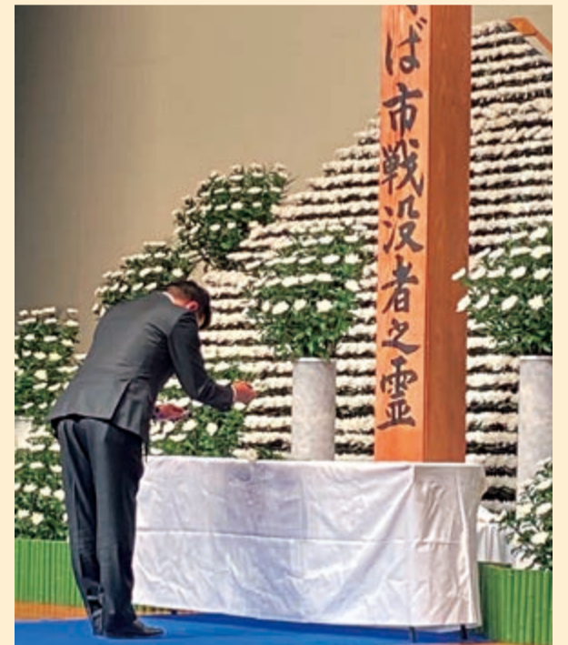
つくば市戦没者追悼式