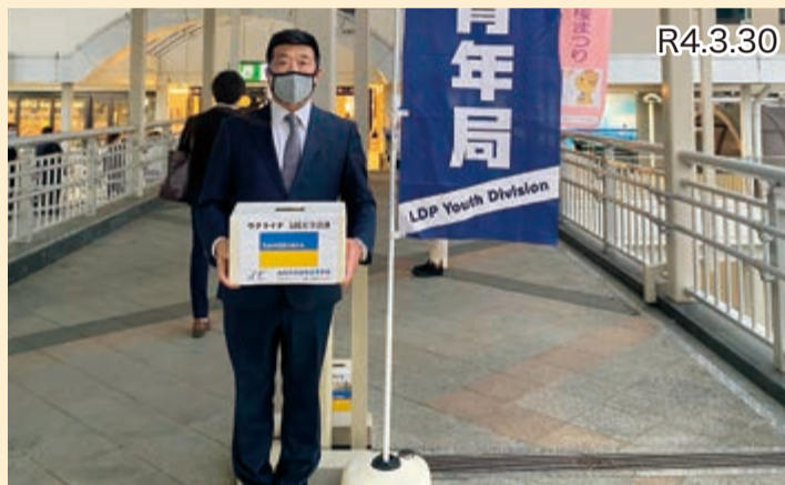
自由民主党青年局、ウクライナ人道支援募金活動 (JR 土浦駅)