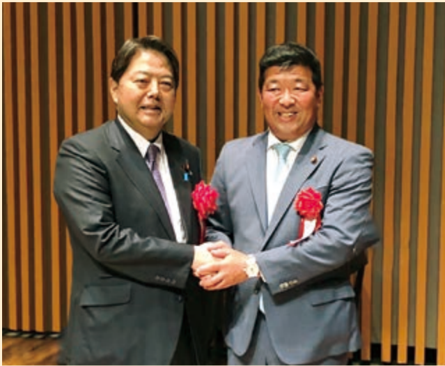
林芳正外務大臣と国光あやのつくば支部後援会にて