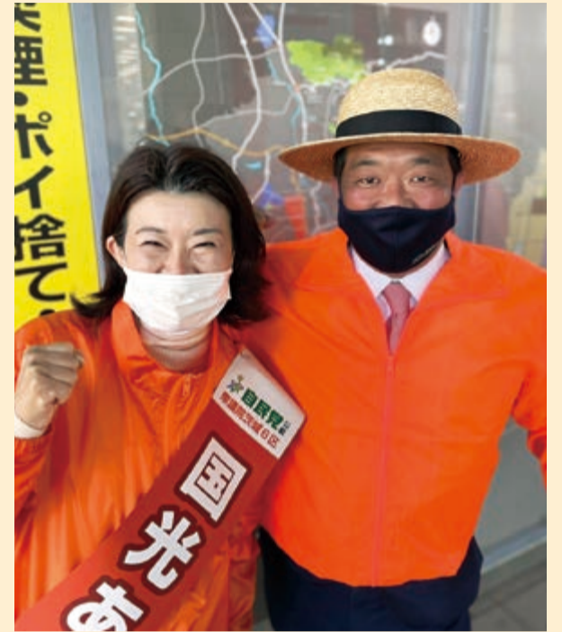
総務大臣政務官に就任した国光あやの衆議院議員とも連携して活動中です。