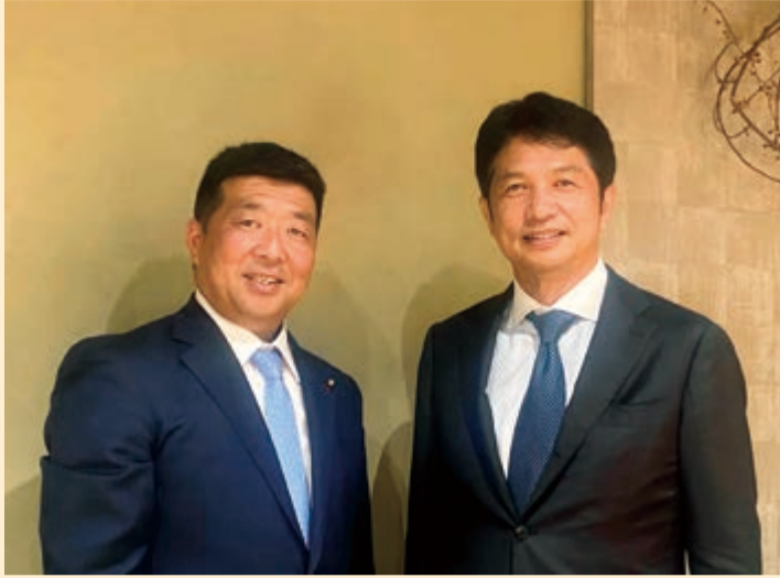
茨城県大井川和彦知事とも課題共有や情報連携して活動して参ります。